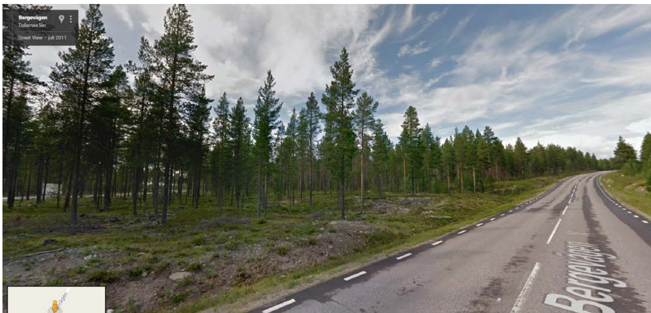
Jupiterplanen mot allmän väg