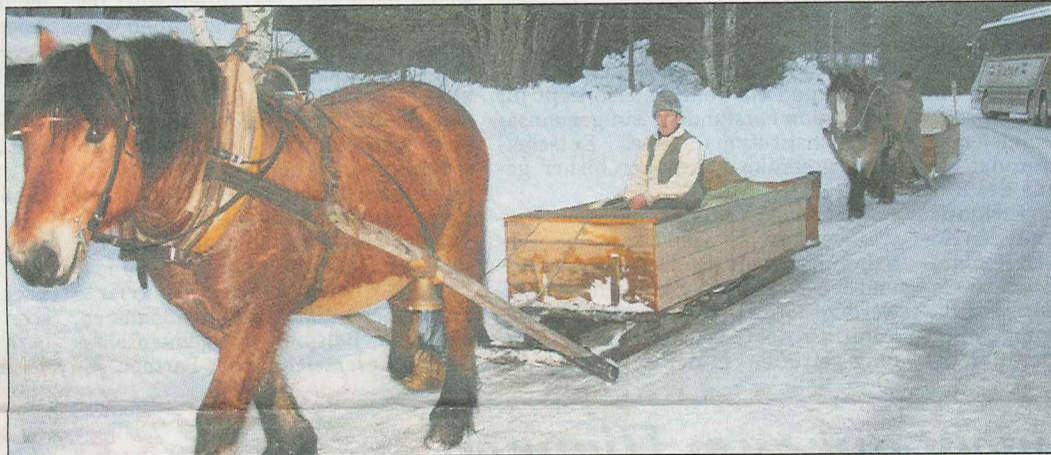
Mit dem Pferdeschlitten durch die verschneite Landschaft. Ein solches Schauspiel lässt sich in Mittelschweden häufig beobachten.