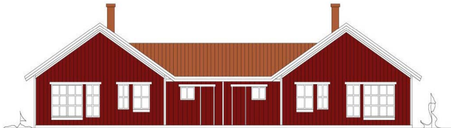
Fasad väster. Hus 10