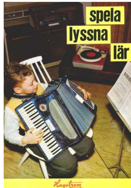
Dragspelskurs på grammofonskiva.