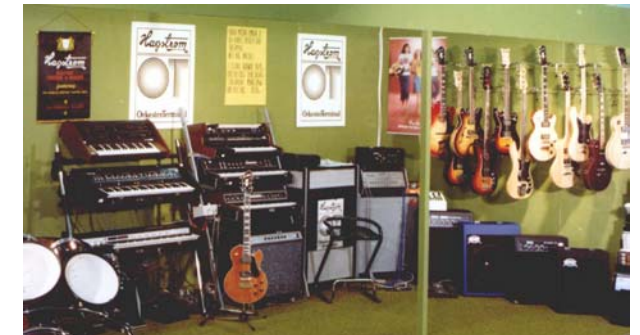
Interiör från Hagströmbutik någonstans i Sverige

1970 skedde en produktionsförändring från dragspel till gitarer, förstärkare, elbasar och sånganläggningar. Hagströms elgitarrproduktion nådde toppen av sin tillverkningskapacitet vid årsskiftet 1977-78. Under åren 1959-77 tillverkades totalt ca 115 000 gitarer.