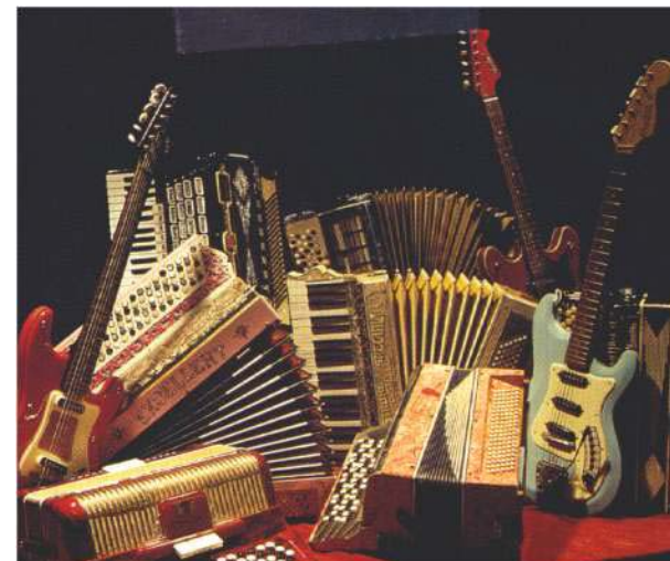
Några klassiker ur Hagströmsortimentet.